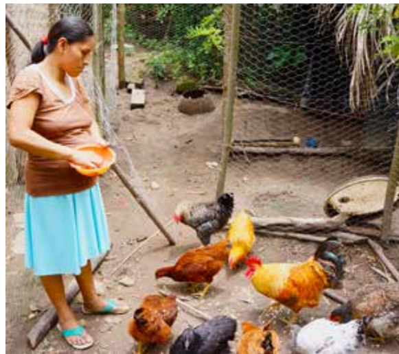
Un pequeño gallinero en la comunidad de Loma Chata construido con el apoyo de APRODAE.

APRODAE es una organización de desarrollo comunitario que trabaja con las comunidades rurales de San José Guayabal. En este proyecto, APRODAE trabaja en cuatro comunidades con 100 personas en situación de vulnerabilidad. La organización brinda asistencia técnica para la construcción de 50 fogones mejorados, 50 pequeños gallineros y el establecimiento de ocho parcelas demostrativas de soya. Además en este proyecto, APRODAE capacita sobre nutrición y cocina saludable.