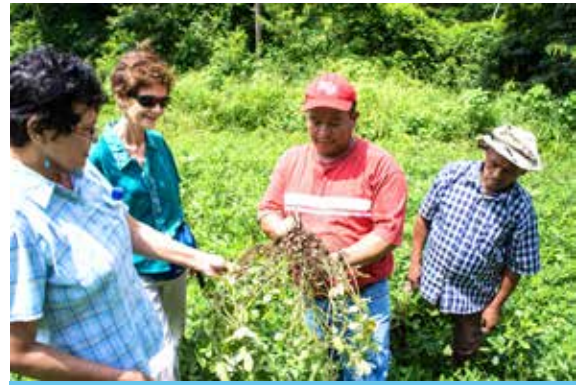
Un campesino muestra a Guadalupe de FUSANMIDJ y a Vera de Kenoli el cultivo de maní (cacahuete).

FUSANMIDJ trabaja para fortalecer poblaciones vulnerables a través de la capacitación, la creación de liderazgo y la incidencia política. En este proyecto, está mejorando la salud de 100 niños/as que sufren de desnutrición al capacitar a sus madres en la preparación de alimentos saludables. Además la organización capacita a ocho nuevas promotoras de salud comunitaria; trabaja con diez familias en el cultivo de soya y maní (cacahuete) para mejorar el acceso local a proteína; desarrolla campañas educativas sobre alimentación sana en cuatro centros de educación pública y compró un vehículo nuevo.