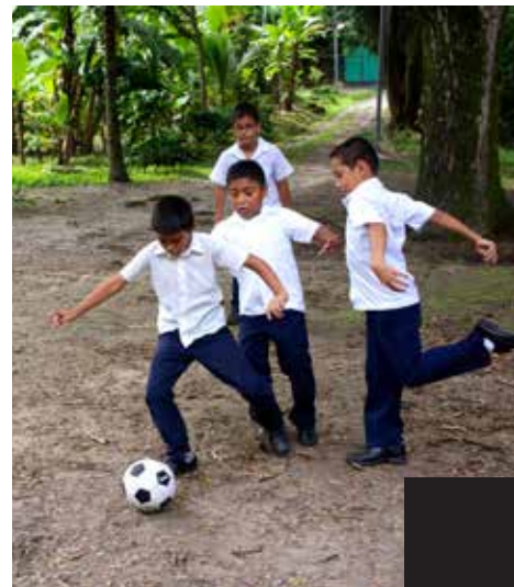
Jóvenes de CENDIMOR juegan fútbol.