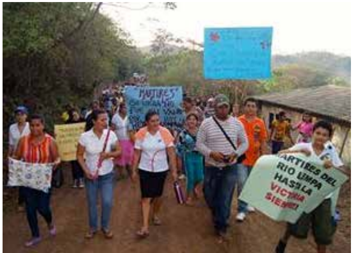
Pobladores/as de Santa Marta conmemoran la masacre de 150 personas por los militares en 1981.

EL SALVADOR sufrió un golpe de estado en 1972 y una guerra civil de 1980-92. Estos sucesos dejaron como secuela una sociedad muy violenta con altos niveles de pobreza. En la actualidad el 34.5% de una población de 6.3 millones de habitantes vive en pobreza. Aun cuando la tasa de homicidios continúa siendo alta, el número de muertes violentas ha disminuido de 70 a 41 por cada 100,000 habitantes 1 derivado de acontecimientos recientes. Tenemos siete excelentes contrapartes en El Salvador trabajando por la seguridad alimentaria, la nutrición, la salud, la creación de oportunidades para mujeres y jóvenes, la defensa de los derechos humanos, específicamente los de los/as consumidores/as.