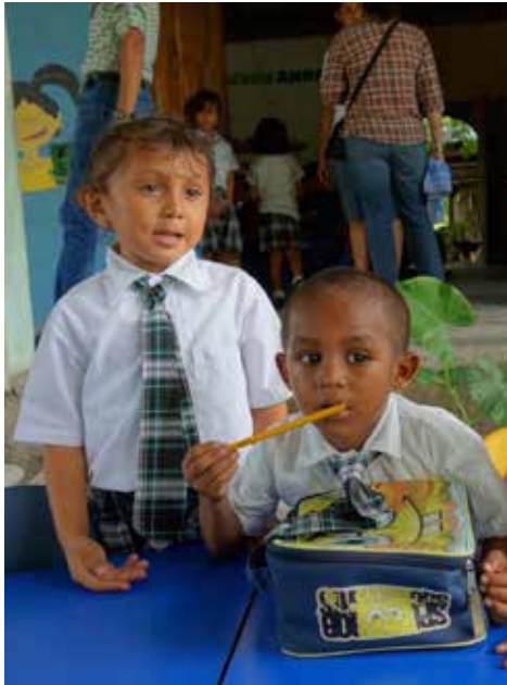
Niños/as en el centro preescolar de ANDAR.

HONDURAS es el lugar más violento del planeta con una tasa de 92 homicidios por cada 100,000 habitantes. El país experimentó una dictadura militar de 1963-83 y en junio de 2009 se produjo un golpe de estado que ocasionó la inestabilidad política y una serie de violaciones a los derechos humanos. El 60% de la población vive en pobreza y aproximadamente 18% en extrema pobreza. 4 Esto indica que éste es el país más pobre en el que trabajamos. Tenemos siete extraordinarias contrapartes que trabajan en condiciones sumamente difíciles en las áreas de: empoderamiento de la mujer, apoyo a la niñez vulnerable en la etapa preescolar, formación técnica para jóvenes, seguridad alimentaria, desarrollo económico y desarrollo integral comunitario.