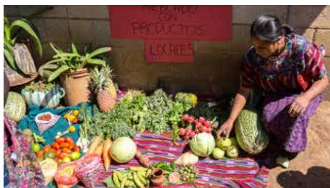
Exhibición de los cultivos de las mujeres del proyecto con ADEMI

Con el apoyo de ADAM, las mujeres de Xeabaj II gestionaron fondos de la municipalidad para construir este nuevo centro comunitario.