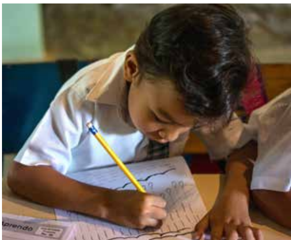
Niño inmerso en su trabajo en el centro preescolar de ANDAR.