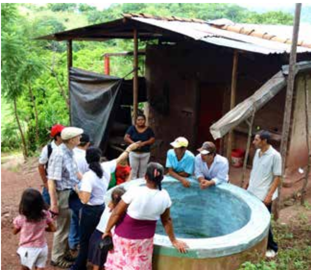
El equipo de Kenoli habla con las personas de las Cruces sobre su trabajo.

El Porvenir mejora las condiciones de vida en las zonas rurales a través de proyectos de agua y saneamiento. En este proyecto con Kenoli se apoya la formación de 60 nuevos/as educadores/as comunitarios/as y 120 maestros/as; la transmisión de programas de radio sobre higiene y saneamiento; la evaluación de la calidad del agua; y la realización de campañas educativas en las escuelas primarias dirigidas a estudiantes y al público en general.