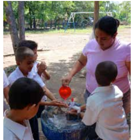
Niños/as de la escuela de la comunidad El Zarzal se lavan las manos con ayuda de su maestra.

▼ Materiales que El Porvenir entrega para aprender sobre higiene.