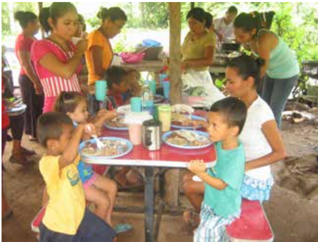
Las madres y los/as niños/as del programa de FUSANMIDJ disfrutaron de un almuerzo saludable.