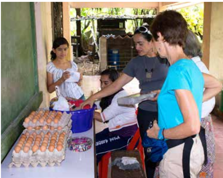
Miembros de Kenoli observan los huevos, proteína que ahora consumen los/as niños/as y se generan ingresos para el centro.