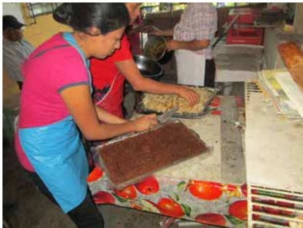
Mujeres del proyecto de ACIDES preparan sus productos para la venta.