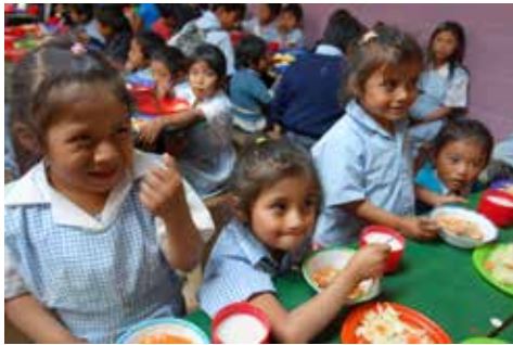
Los/as niños/as del SEA disfrutaron de un almuerzo saludable.

Casa Sito amplía las oportunidades de educación para que los/as niños/as indígenas de las zonas rurales que viven en condiciones de pobreza, puedan tener más acceso a la educación. Kenoli apoya la organización con los siguientes programas: becas para que 20 estudiantes de secundaria y de universidad tengan estipendios mensuales, talleres y asesorías psicológicas; apoyo nutricional para 40 niños/as vulnerables del Programa Semilla de Esperanza y Amor (SEA) en San Mateo de Milpas Altas; y el último programa es para jóvenes, "Teatro del Oprimido."