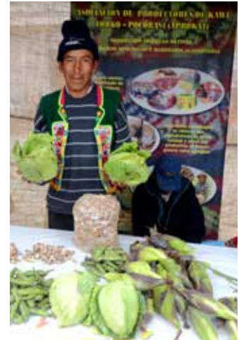
Participante de PRODII muestra su producción agrícola. ▶

BOLIVIA es un país sin litoral con una población de 10.2 millones de habitantes. Es el país más pobre y menos desarrollado de Sur América. El 51% de su población vive en pobreza y un 15.6% en extrema pobreza. La mayoría de su población (62%) es indígena. La expectativa de vida no supera los 67 años y el índice de desigualdad de género es relativamente alto, 0.44. No obstante, tiene el nivel educacional más alto de los países en que trabajamos con un promedio de 9.2 años de escolaridad entre la población adulta. En Bolivia, trabajamos con la contraparte de USC-Canadá, PRODII, en las áreas de empoderamiento de la mujer y la mejora de la seguridad alimentaria.