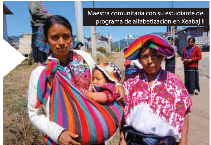
Maestra comunitaria con su estudiante del programa de alfabetización en Xeabaj II

ADAM trabaja con 80 mujeres mayas que viven en condiciones de extrema pobreza en la comunidad de Xeabaj II del Municipio de Santa Catarina. El trabajo se enfoca en fortalecer sus iniciativas económicas con la producción agrícola, las lombricomposteras, los silos para granos básicos, y la crianza de toritos. Asimismo, 27 mujeres participaron en el programa de alfabetización, y ahora la comunidad está desarrollando un plan para la mitigación de los riesgos ocasionados por el cambio climático en su zona.