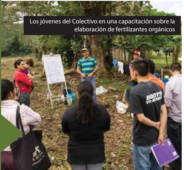
Los jóvenes del Colectivo en una capacitación sobre la elaboración de fertilizantes orgánicos

El Colectivo trabaja para mejorar las condiciones de las mujeres que trabajan en las fincas y beneficios de café de Matagalpa. Apoyan a una cooperativa de 35 jóvenes en sus habilidades de agricultura orgánica y temas empresariales; y dan capacitaciones a 40 promotores jóvenes sobre el código laboral y entrenan 50 promotores sobre el código familiar y sobre la ley de acceso a la tierra. También tienen programas radiales.