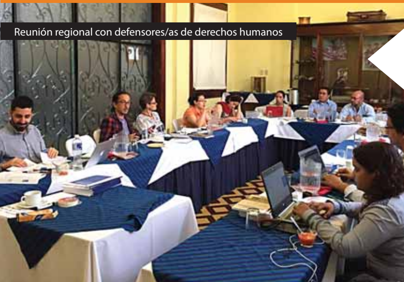
Reunión regional con defensores/as de derechos humanos