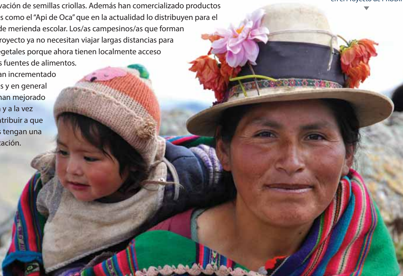
Madre e hija participan en el Proyecto de PRODII

También han incrementado sus ingresos y en general dicen que han mejorado la nutrición y a la vez podido contribuir a que sus hijos/as tengan una mejor educación.