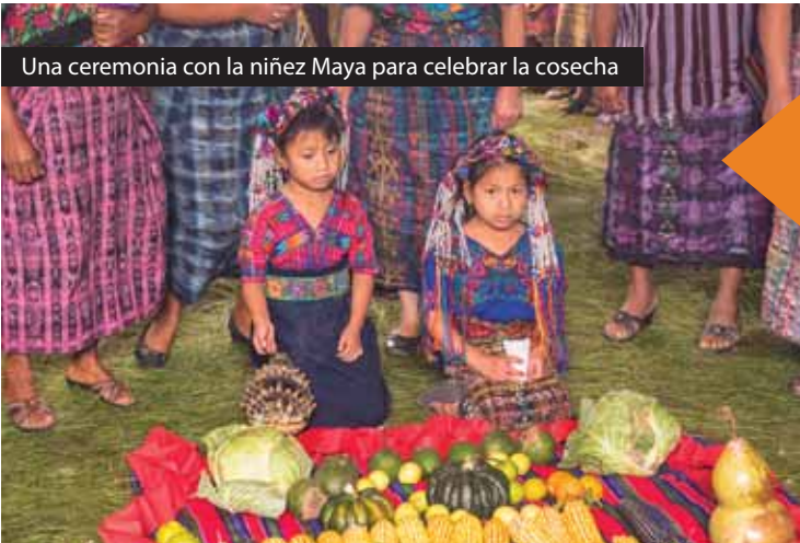
Una ceremonia con la niñez Maya para celebrar la cosecha