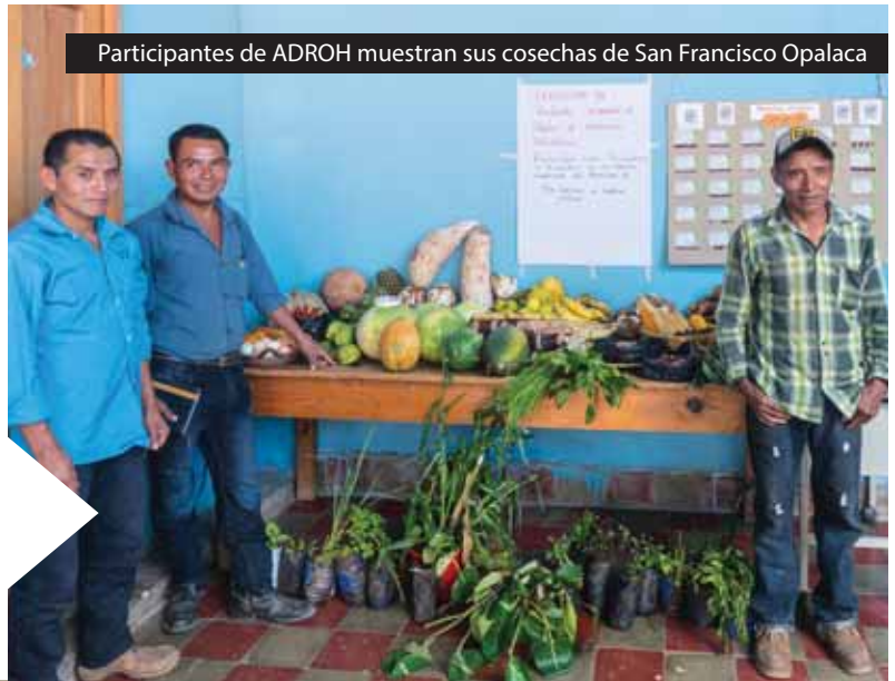
Participantes de ADROH muestran sus cosechas de San Francisco Opalaca

ADROH fortalece a 125 familias indígenas lenkas en sus habilidades para la agricultura sostenible, la recolección de semillas nativas, la producción de medicinas naturales y la promoción de la igualdad de género en 7 comunidades de las montañas de San Francisco Opalaca en Intibucá. También han comprado un vehículo para el transporte hacia esas zonas.