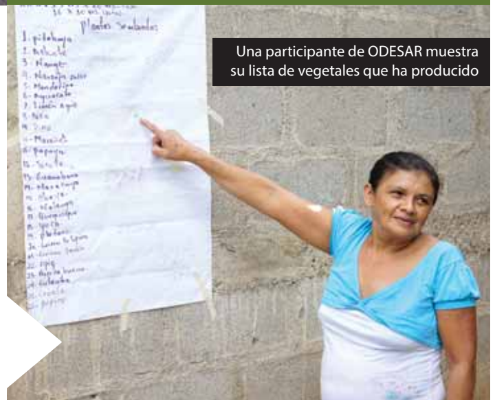
Una participante de ODESAR muestra su lista de vegetales que ha producido

ODESAR trabaja con 300 familias en 8 comunidades rurales de Esquipulas, Matagalpa para reducir la pobreza y empoderar a la población local a través de la organización comunitaria, garantizar la seguridad alimentaria, ofrece capacitaciones en género y salud reproductiva, trabaja en agua y saneamiento (instalando 80 filtros de agua, construcción de 50 inodoros y 50 sistemas de tratamiento de aguas residuales y la instalación de cuatro sistemas de cloración de agua) y en el fortalecimiento del liderazgo juvenil en las comunidades rurales.