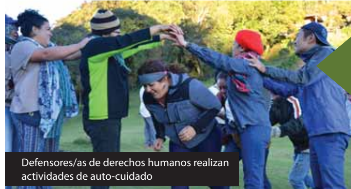
Defensores/as de derechos humanos realizan actividades de auto-cuidado