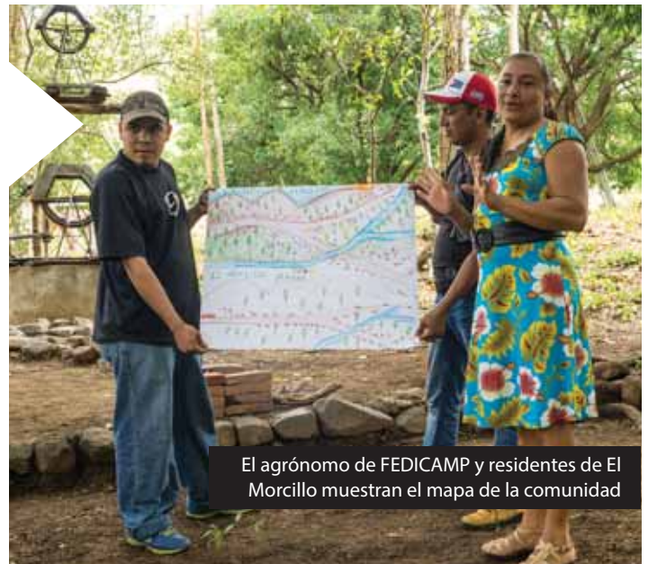
El agrónomo de FEDICAMP y residentes de El Morcillo muestran el mapa de la comunidad

FEDICAMP trabaja para fortalecer la seguridad alimentaria y mejorar la dieta de 285 familias en 18 comunidades rurales de la zona Norte. Ellos brindan capacitación técnica en agroecología y nutrición, fortalecen los bancos de semillas criollas y capacitan a las COMUSSAN (Comisiones Municipales sobre Seguridad y Soberanía Alimentaria y Nutricional) en los Municipios donde trabaja la organización.