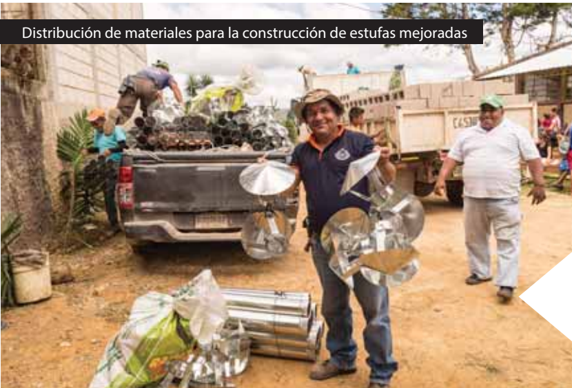
Distribución de materiales para la construcción de estufas mejoradas