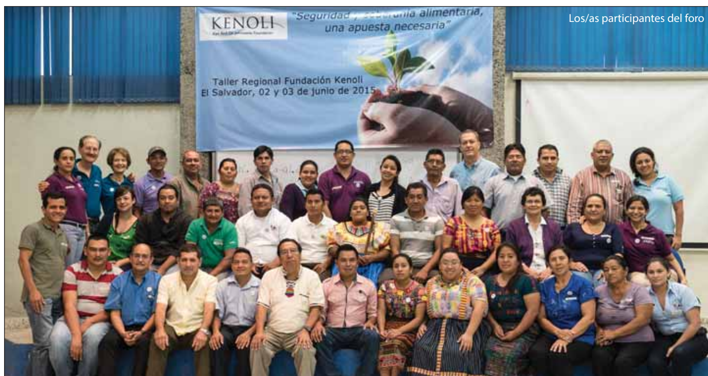
Los/as participantes del foro