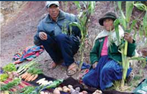
▲ Participantes de PRODII muestran sus cosechas