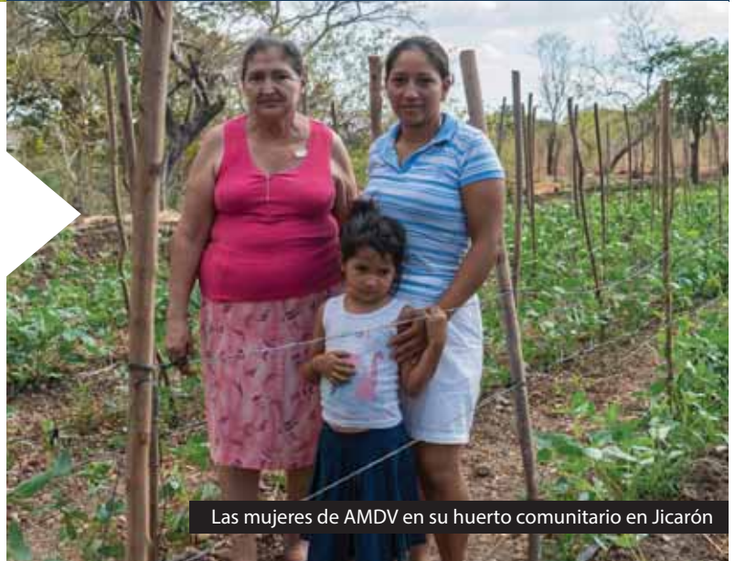
Las mujeres de AMDV en su huerto comunitario en Jicarón

AMDV mejora la salud y la nutrición de 138 niños/as, construye 30 estufas mejoradas, establece 32 huertos familiares, 2 huertos comunitarios y 1 huerto escolar.