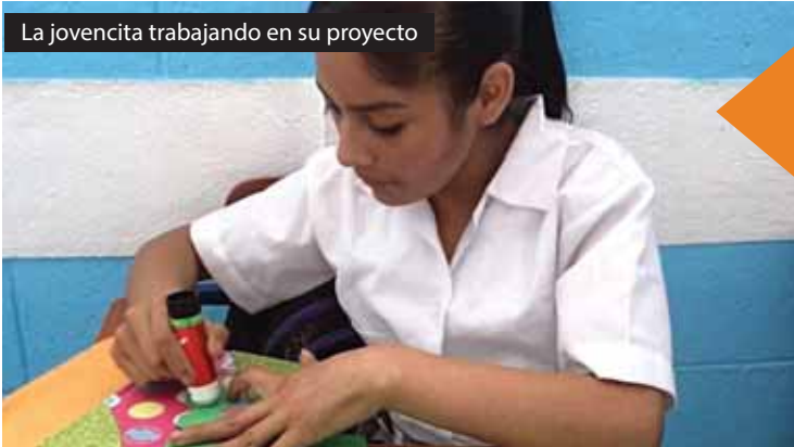
La jovencita trabajando en su proyecto