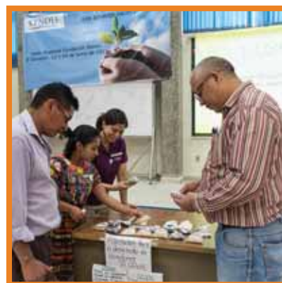
Participantes en la exposición de semillas criollas de ADROH