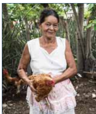
¡Los gallineros colectivos han sido un éxito!

▲ El equipo de Kenoli de visita con los/as participantes del Proyecto de Mangle en Puerto Parada