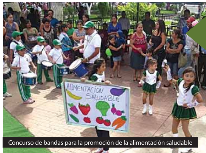
Concurso de bandas para la promoción de la alimentación saludable