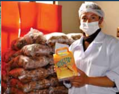
▲ La Oca se transforma en galletas para la merienda escolar de los/as niños/as