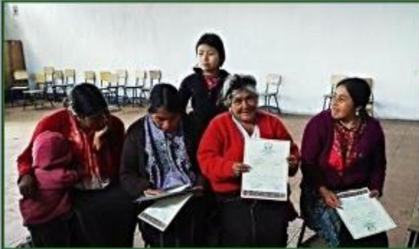
Señoras con sus diplomas de alfabetización

El proceso de alfabetización en la comunidad de Xeabaj II, del Municipio de Santa Catarina Ixtahuacán, del departamento de Sololá en Guatemala, ha sido un sumario de formación. Las mujeres indígenas organizadas no sabían leer ni escribir y esto les afectaba significativamente de muchas maneras, principalmente en su autoestima. El proyecto que ADAM desarrolló con el apoyo