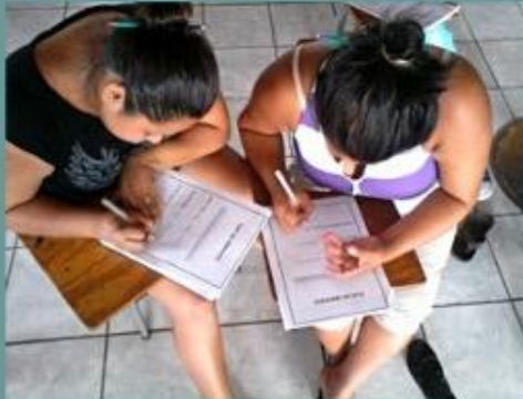
Preparando planes de negocio