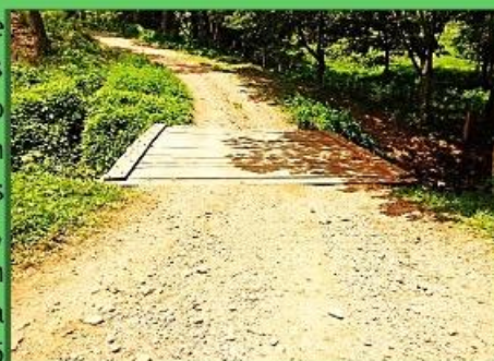
Puente que facilita el acceso a la comunidad

En la comunidad de El Portón municipio de Esquipulas en Matagalpa, Nicaragua, los/as líderes/as organizados/as con el proyecto de ODESAR-Kenoli presentaron ante sesión del Concejo Municipal las necesidades de los pobladores. Como resultado, en el año 2015, se aprobó la iniciativa para construir un puente que facilite el acceso a la comunidad. La iniciativa beneficiará a 215 familias, que podrán hacer uso del puente para que vehículos como la ambulancia pase cuando hay casos críticos de salud. Además será una vía para el transporte seguro de personas y para la comercialización de sus excedentes de producción.