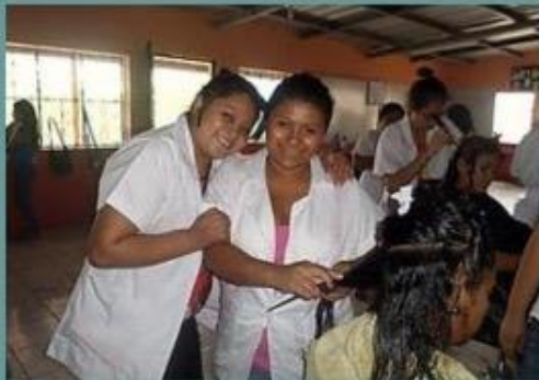
Lavando y secando pelo