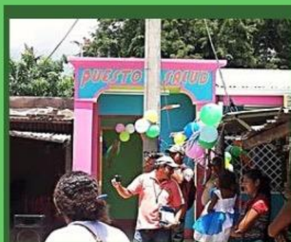
Inauguración del Centro de Salud

participación ciudadana y asistieron a varias sesiones del Consejo Municipal para demandar este proyecto para la comunidad. En mayo de 2015, el proyecto de reparación de la carretera fue aprobado, beneficiando a 1,350 personas de tres diferentes comunidades (La Ceiba, La Rondalla y El Gorrión). Este éxito no les dejó detenerse y ahora inciden para que a la comunidad lleguen otras iniciativas en el sector salud y educación. Algunas de estas también han sido aprobadas en este año y otras van a llegar con el tiempo; gracias al esfuerzo de las personas organizadas que luchan por mejorar la calidad de vida de las familias.