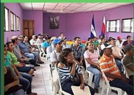
Reunión de la Comisión de Gestión

En otra comunidad de Esquipulas, Matagalpa; La Ceiba, desde finales del año 2014, participantes del proyecto se organizaron en estructuras comunitarias. La Comisión de gestión inició el proceso de incidencia para la reparación y mantenimiento de 2 km de carretera que permita el acceso como vía de comunicación que les uniera a otras comunidades. Con sus propios recursos se movilizaron para ejercer su derecho de