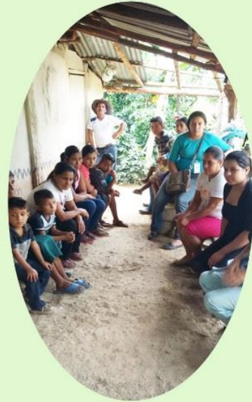
Participantes del proyecto nos comentan el aprendizaje obtenido