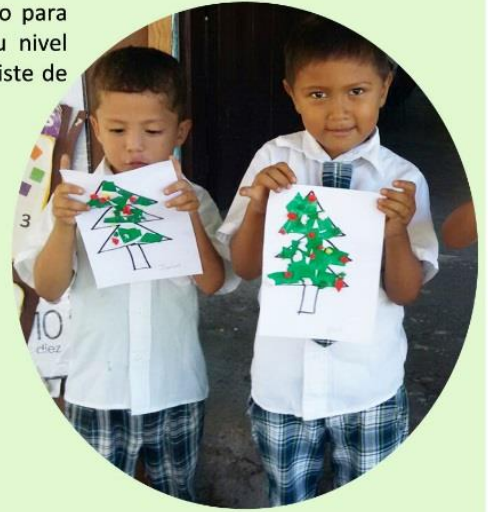
Los niños y niñas en sus últimos días del año escolar