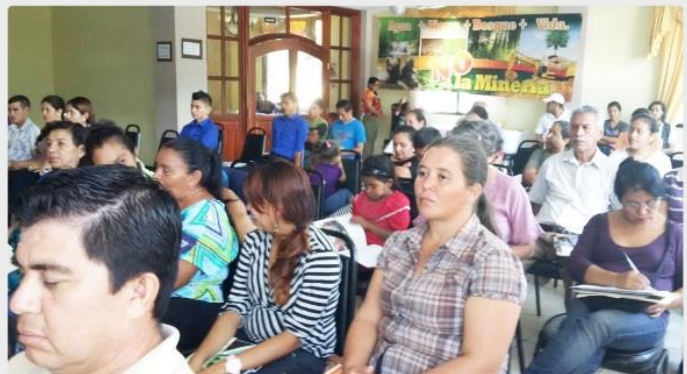
Desarrollo del Foro sobre Derechos Humanos que organizaron los grupos locales