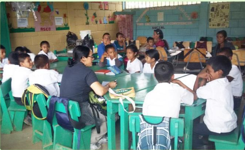
Los/as niños/as aprendieron este año sobre participación ciudadana y género con las cartillas de Siempre Vivas

¡VH y su equipo sigue contribuyendo al cambio de las generaciones futuras!