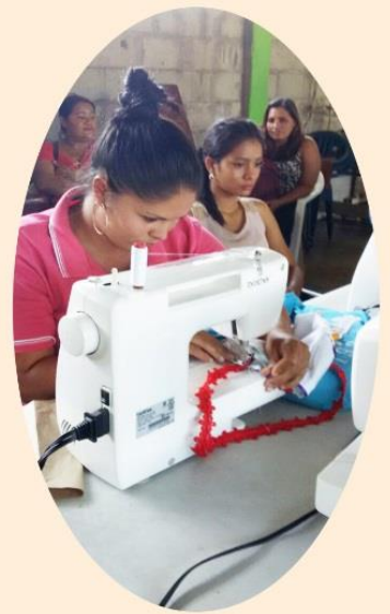
¡Las participantes muestran orgullosas su trabajo!