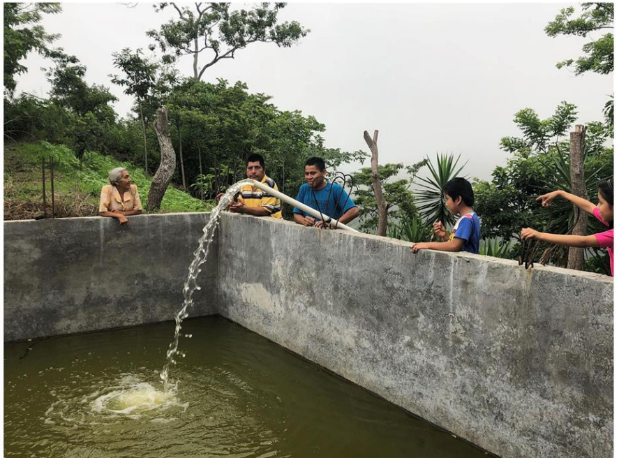
La Comunidad ahora cuenta con una pila para regar sus cultivos en ambos lados del cerro

El área donde viven las familias es un tanto difícil para cualquier tipo de cultivo, especialmente durante la época seca. Tenían que acarrear el agua en baldes para regar cada cultivo. Con la ayuda de ACIDES, ahora cuentan con el servicio de energía eléctrica conectada profesionalmente en la comunidad.