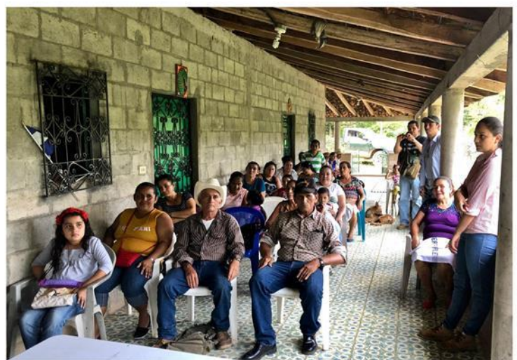
Habitantes de la Comunidad Santa Rosa tienen muchas expectativas en este nuevo proyecto