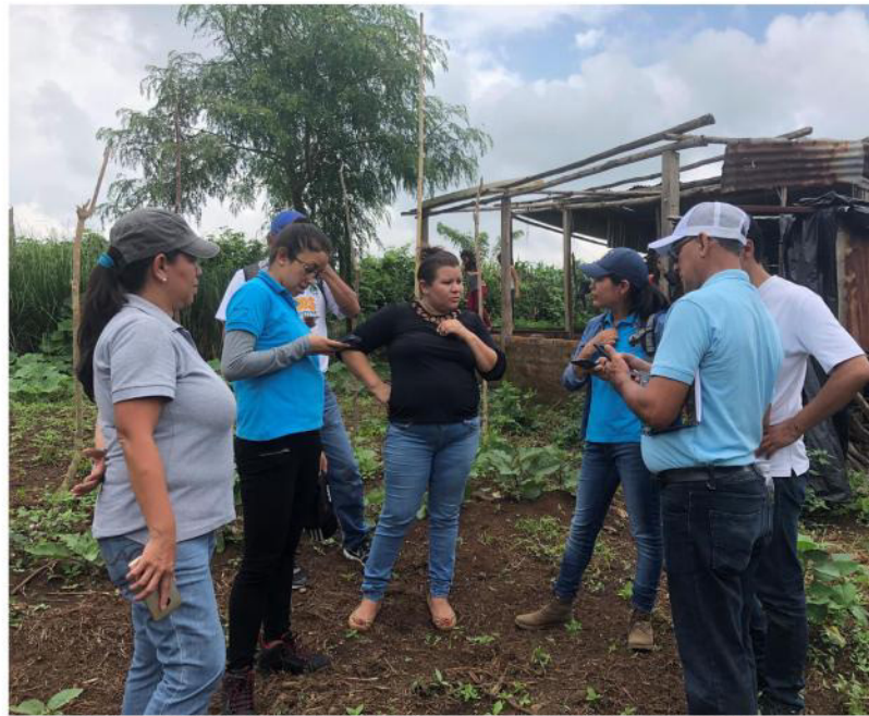
Los/las participantes del taller recolectando datos en el campo