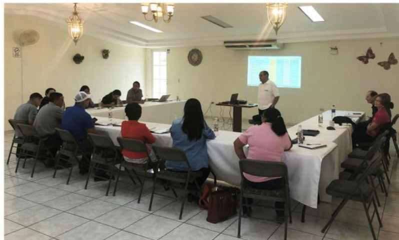
Los/las participantes del taller durante el evento