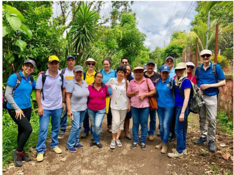
Los/las participantes del taller después de recolectar datos en el campo