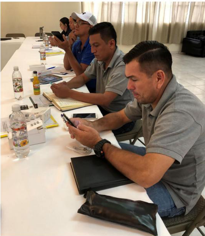
Compañeros de FEDICAM y AMDV realizan pruebas en la aplicación