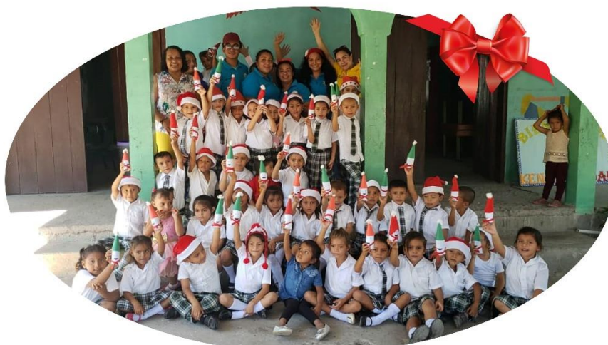
Llegamos con el saludo de Feliz Navidad de los niños y niñas del Centro Infantil de ANDAR en Cedeño, Choluteca en Honduras

Deseamos a ustedes lo mejor estos días y esperamos que el próximo año sigamos caminando hacia nuevos compromisos y nuevas luchas por reducir la pobreza y el hambre en Centro América.