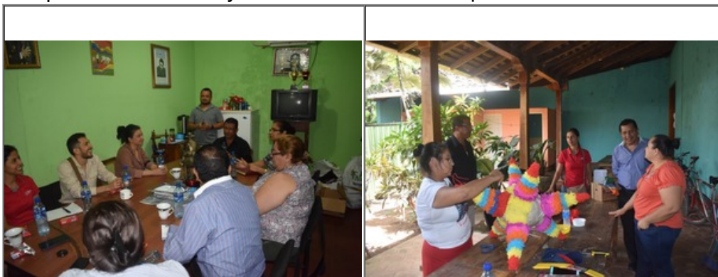
Visita a la Alcaldía de El Sauce

Alcaldías garantizan: material didáctico, infraestructura, equipos, mobiliarios y un complemento al salario de los facilitadores. Hasta ahora, en esta Alcaldía se han ofertado, 53 cursos para 800 egresados/as. DION quedó impresionado, tiene compromisos para regresar a impartir cursos y participar de un Congreso Nacional de Instructores/as y Formadores/as en Educación Técnica. ¡Gracias por todo INATEC y Alcaldía de El Sauce! ¡Excelente DION!