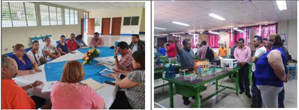
Grupo Juvenil DION visitando el Centro Tecnológico Comandante Camilo Ortega Saavedra

También visitaron el Centro Tecnológico Comandante Hugo Chávez Frías en Managua. En el 2019 se han matriculado 1743 estudiantes en carreras técnicas y 3950 protagonistas en cursos de capacitación y otros 800 estudian Técnico general en docencia. Acá se imparten 54 cursos de educación técnica y 43 cursos de capacitación que hacen uso de 9 aulas equipadas con tecnología de punta.