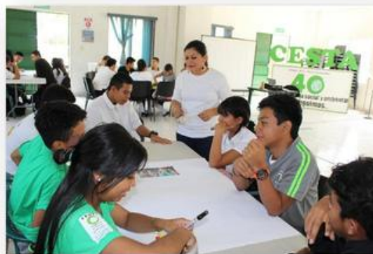
Líderes y lideresas estudiantiles participando en formación socio ambiental