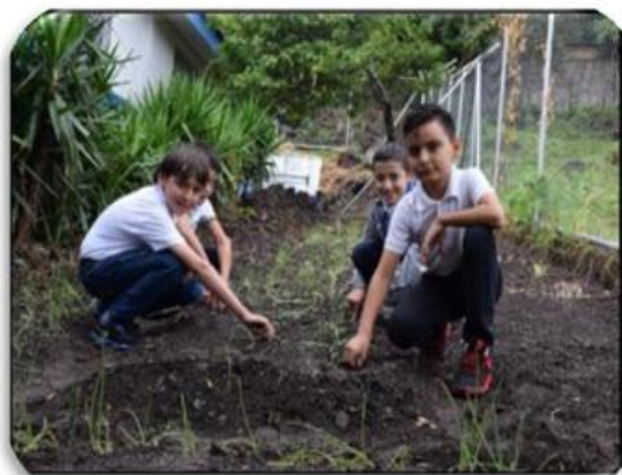
Trabajando en el huerto escolar