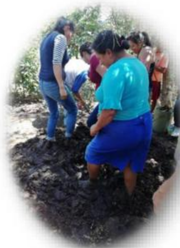
Mujeres en prácticas sobre elaboración de adobes